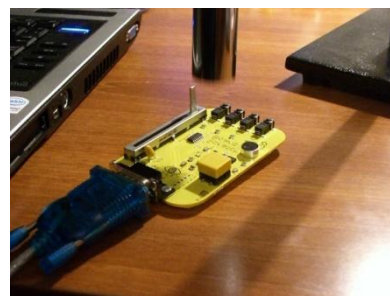
Σχήμα 2. Η διάταξη μελέτης των ταλαντώσεων