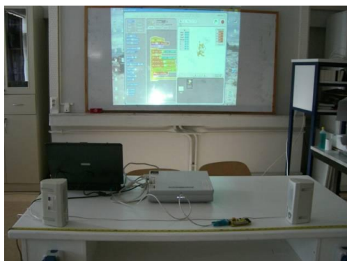
Σχήμα 1. Η διάταξη μέτρησης της ταχύτητας του ήχου στον αέρα

περιόδου από τη μάζα του σώματος και τη σταθερά του ελατηρίου, καθώς και την ανεξαρτησία της περιόδου από το πλάτος ταλάντωσης. Στο Σχήμα 3 αναπαριστώνται δύο γραφικές παραστάσεις που προκύπτουν όταν χρησιμοποιούνται δυο ελατήρια με διαφορετικές σταθερές. Η δραστηριότητα αυτή έχει εφαρμοστεί επιτυχώς τόσο από μαθητές της Γ' Λυκείου για την ποσοτική μελέτη των ταλαντώσεων όσο και από μαθητές της Γ' Γυμνασίου για την εισαγωγή των βασικών εννοιών της ταλάντωσης. Και στις δυο περιπτώσεις απαιτήθηκαν 2 διδακτικές ώρες.