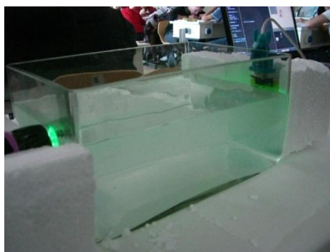
Σχήμα 4. Η διάταξη μέτρησης της έντασης του φωτός που διέρχεται από οπτικά μέσα