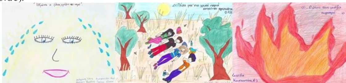
Εικόνα 3: οπτικοποίηση του μελοποιημένου ποιήματος από μαθητές Α΄ Γυμνασίου

Η αναζήτηση στο youtube μπορεί να μας δώσει και άλλα αποτελέσματα. Θα σταθούμε σε δύο ακόμα, τα οποία για τις ανάγκες αυτής συγκεντρώθηκαν στο ιστολόγιο «ερμηνεία της ποίησης» ( http://melisopula.blogspot.gr ). Πρώτα ένα που βασίζεται στην ίδια ερμηνεία, αλλά η οπτικοποίησή του αξιοποιεί σε μεγάλο βαθμό εικόνες που δημιούργησαν μαθητές. Σύμφωνα με τις πληροφορίες του βίντεο πρόκειται για δουλειά από το μαθητές του 1ου Γυμνασίου Αργους. Η οπτικοποίηση εκφράζει ευχάριστα συναισθήματα με τα σκίτσα των μαθητών να αποτυπώνουν συγκεκριμένους στίχους (βλέπε εικόνα 3).