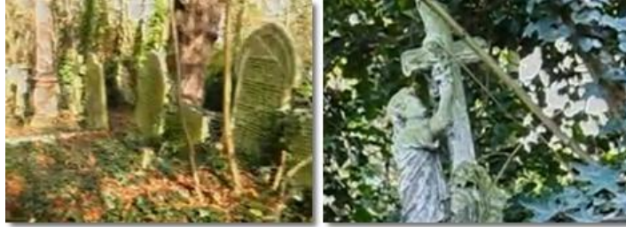
Εικόνα 4: οπτικοποίηση του μελοποιημένου ποιήματος στο Abney Park Cemetery

Κωχ (δίσκος «Μια στο καρφί και μια στο πέταλο», 1973). Επίσης, φαίνεται ότι έχουμε εντελώς διαφορετική πρόσληψη σαφώς από άτομο με διαφορετικές εμπειρίες και μεγαλύτερης ηλικίας. Ο γρήγορος («ξέφρενος» χαρακτηρίζεται σε ένα από τα σχόλια) ρυθμός συνοδεύεται από την επίσης γρήγορη κίνηση της κάμερας που καταγράφει εικόνες από πάρκο μέσα στο οποίο βρίσκεται παλιό κοιμητήριο (Abney Park Cemetery) στο Λονδίνο. Η πρόσληψη των στίχων έρχεται σε αντίθεση με όσα είδαμε στις δύο πρώτες περιπτώσεις και σαφώς δεν πρόκειται για ερμηνεία που θα μπορούσε να σταθεί στην Α΄ Γυμνασίου. Ενδεικτικές είναι οι δύο φωτογραφίες στην εικόνα 4.