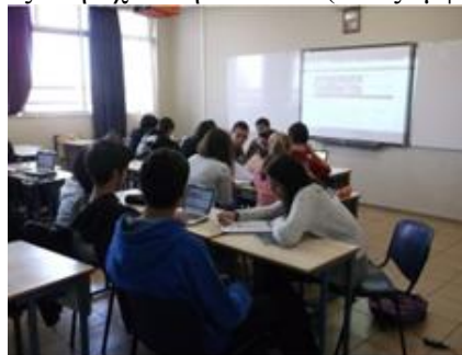
Σχήμα 3: Οι μαθητές εργάζονται ομαδοσυνεργατικά

Το ιδιαίτερο σε όλη τη διαδικασία, είναι πως τα projects είναι δομημένα με ερωτήσεις – δραστηριότητες. Κάθε μαθητής σε κάθε ομάδα, έχει τη δική του ή τις δικές του ερωτήσεις που έχει αναλάβει να απαντήσει, μετά από συνεννόηση με την υπόλοιπη ομάδα. Δίπλα λοιπόν από κάθε project υπάρχουν γραμμικά οι ερωτήσεις του. Στην ίδια στήλη υπάρχει η επιλογή Εργασίες μαθητών όπου ο συντονιστής της κάθε ομάδας, έχει αναλάβει να οργανώσει την ομάδα, αλλά και να αναρτήσει την εργασία σε μορφή MS Powerpoint και την επεξεργαστούν κατάλληλα πριν την τελική υποβολή της. Έχει αναρτηθεί φωτογραφία, ενδεικτική, για τον τρόπο εργασίας στη σχολική αίθουσα (όπως εμφανίζεται στο Σχήμα 3).